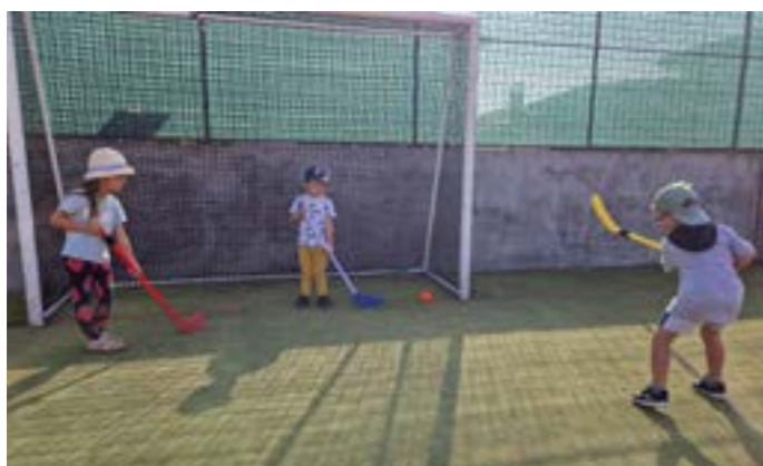
Učíme se florbal.