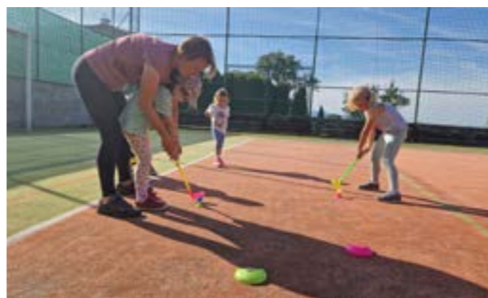
A nově zkoušíme také golf.