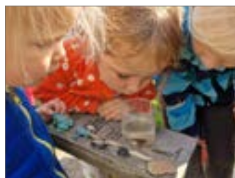
Školka v obrazech.....str. 6 až 8