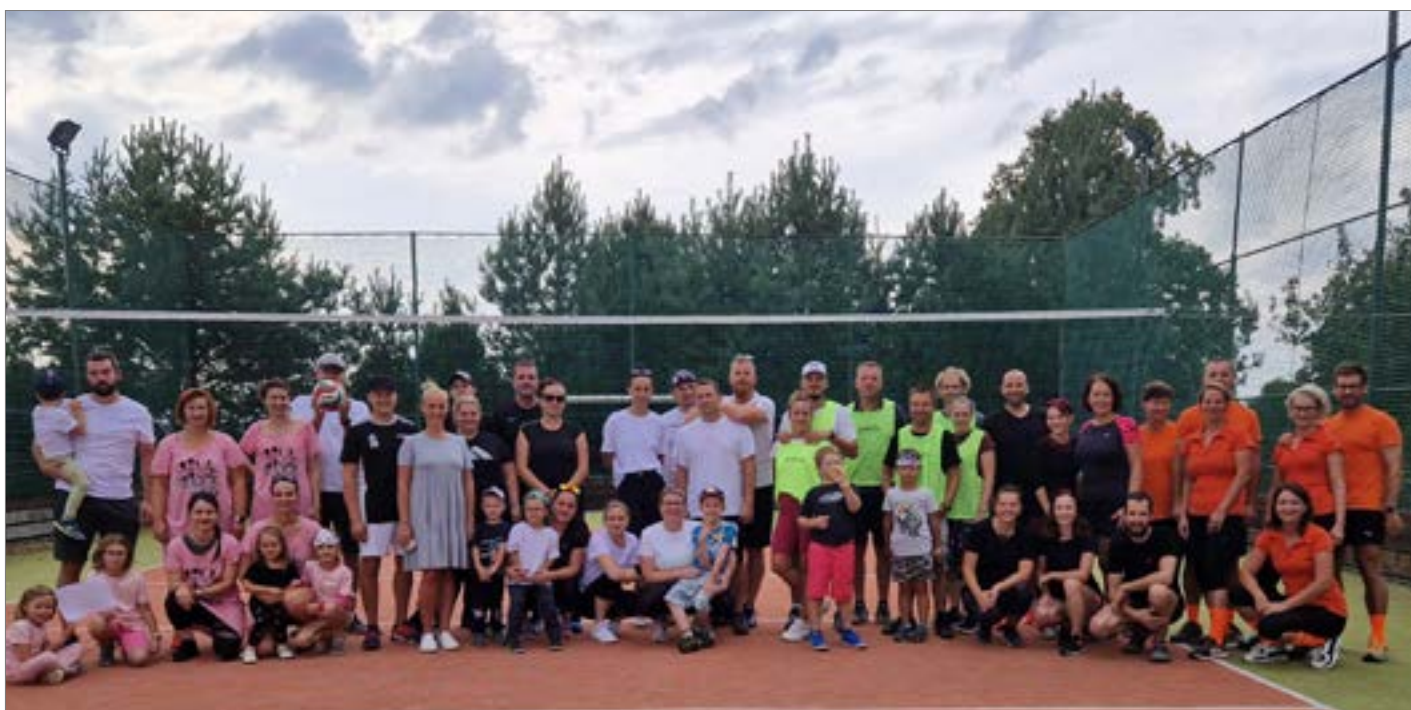
Špičková školka uspořádala Srandamač, celý článek najdete na straně 9.