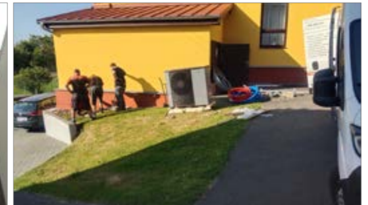
Dvacet jedna let staré topné agregáty na obecním úřadě a mateřské škole byly nahrazeny novými, které, věřím, budou ne jen efektivnější, ale v dnešní době hlavně ekonomičtější. Stávající plynový kotel v mateřské školce byl nahrazen plynovým kondenzačním kotlem se zabudovaným dostatečným bojlerem. Budovu obecního úřadu bude nově vytápět tepelné čerpadlo. Stávající plynový kotel je ponechán jako záložní zdroj.