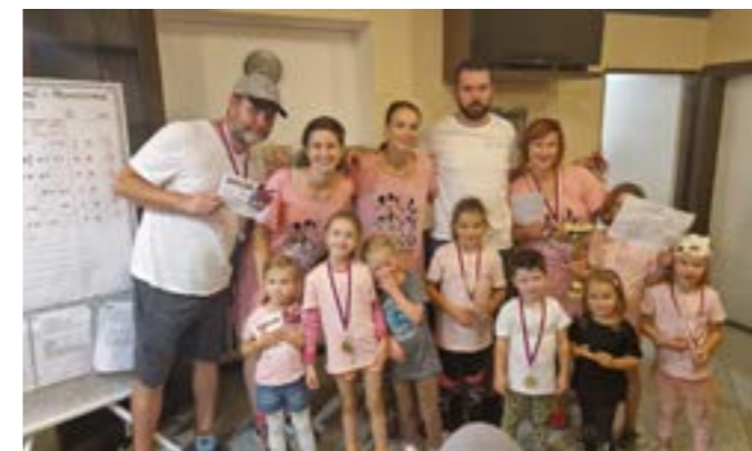
První místo AAA kam? Do Špiček!