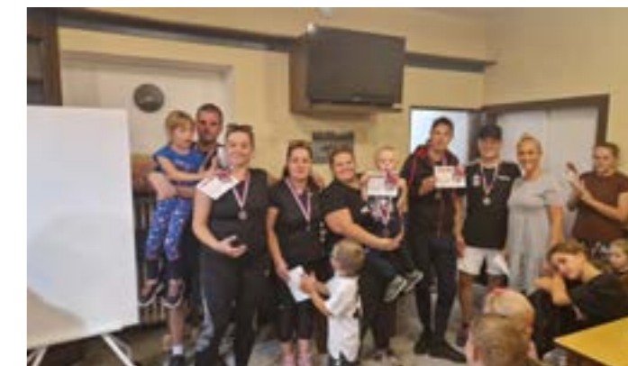
Druhé místo Black team

V pátek 22. září jsme pro naše bývalé i současné rodiče uspořádali Špičkový Srandamač v přehazované. Přihlásilo se 6 družstev po šesti hráčích. Pro děti byl připraven doprovodný program. Byly k vidění nádherné výměny, tatínky při smích vyskakovali vysoko nad síť, děti fandily o stošest a vzduchem se nesl smích. Na třetím místě nakonec skončilo družstvo v bílém - Chráněná dílna. Druhé místo obsadil černý Black team a na prvním místě se umístilo družstvo růžové s názvem: AAA kam? Do Špiček! Hlavním cílem tohoto srandamače bylo dobře se pobavit, seznámit nové rodiče se stávajícími i bývalými, nezranit se a být pro své děti při sportování vzorem. To se myslím opravdu povedlo. Medaile prvním třem družstvům samozřejmě zůstávají, ale putovní pohár vítězného družstva musí vrátit, protože příští rok máme v plánu další sportovní kulišárnu. Tak si říkáme, že se třeba ze Špičkového srandamače stane hezká tradice. Zuzka Stejskalíková, ředitelka MŠ Špičky