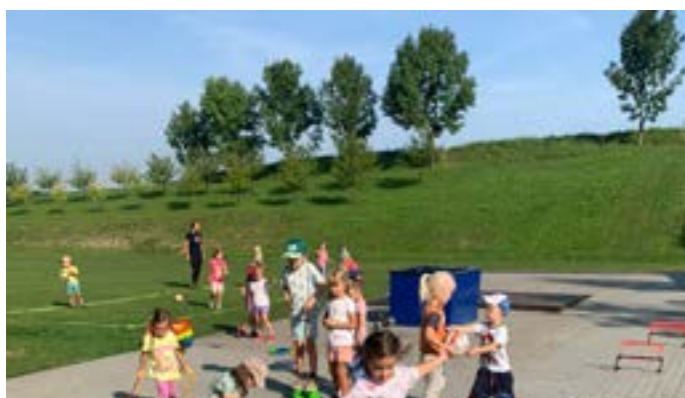
Pravidelně chodíme cvičit ven na hřiště nebo na multifunkční hřiště za kulturní dům.