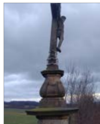
V řádném termínu byly panem Krasňákem předány opravy křížů u Bartošického a na Kunčice. Již letos započne oprava toho nejnáročnějšího (co se týče rozsahu prací), největšího a posledního kříže na Vrbičkově ve výši 264 tisíc korun. (Spolufinancováno díky 70% dotaci MZe).