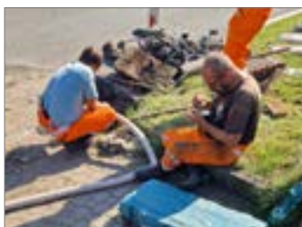
Máme za sebou.....str. 2 a 3