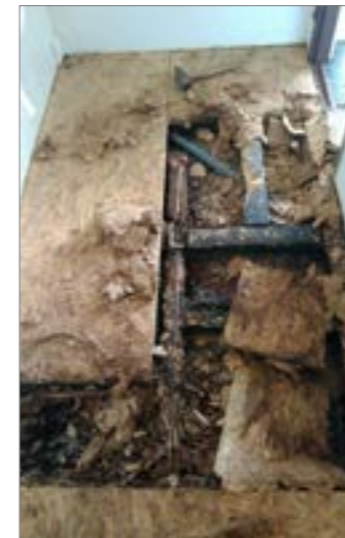
Zub času a zřejmě i zvolená technologie se projevila na podlahách na sociálních zařízeních na hasičském hřišti, která si vyžádá nemalou rekonstrukci.