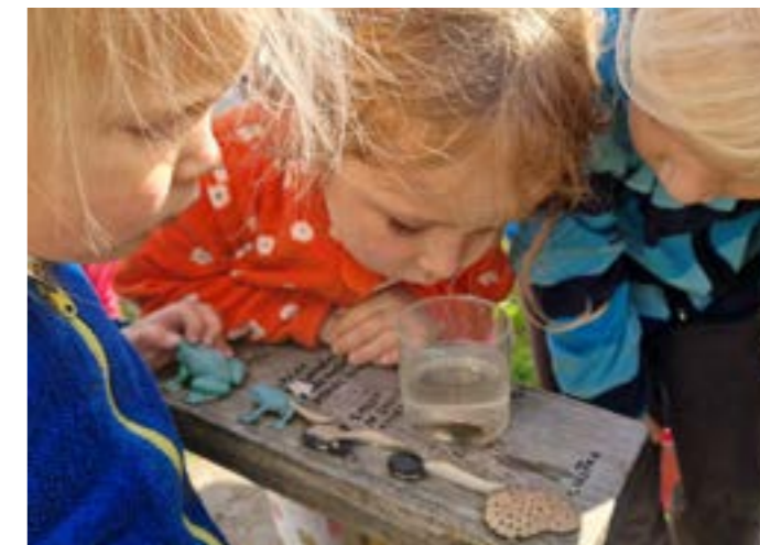
Mnoho času trávíme na přírodní zahradě odlovem a určováním vodních živočichů.