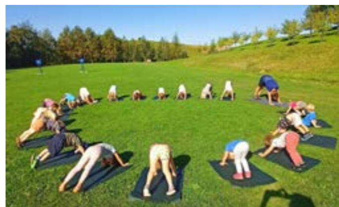
Pravidelně cvičíme jógu.