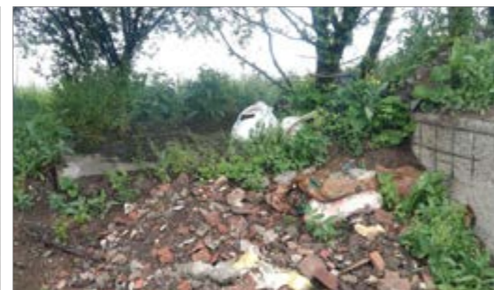
Bohužel zanedlouho po akci „Uklidme Česko“ se na totožných uklizených místech objevil znova „lidský odpad“, který mohl posloužit k dalšímu užití, ať už v podobě stavebního recyklátu nebo kompostu, stačilo legálně umístit na patřičné místo a ne do přírody, kterou jsme si my sami občané poctivě a precizně uklidili.