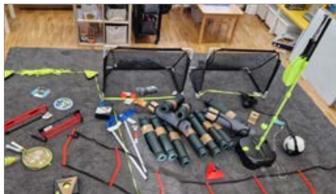
Od mysliveckého spolku Hejné jsme dostali dar 5.000Kč. Z peněz jsme částečně dovybavili školku tělocvičným náčiním. V letošním roce se chceme totiž s dětmi ještě více věnovat sportu.