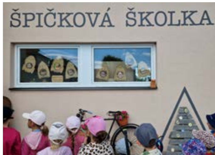
O prázdninách jsme zrealizovali již tradiční setkání dětí ve školce. Naposledy jsme se tak mohli ještě rozloučit s našimi 11 předškoláky, kteří v září odletí do školy.