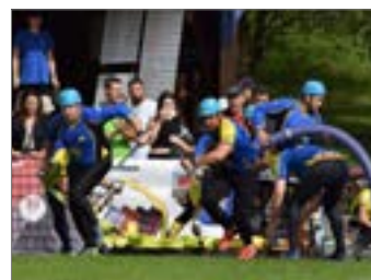
Spolkový život.....str. 10 až 12