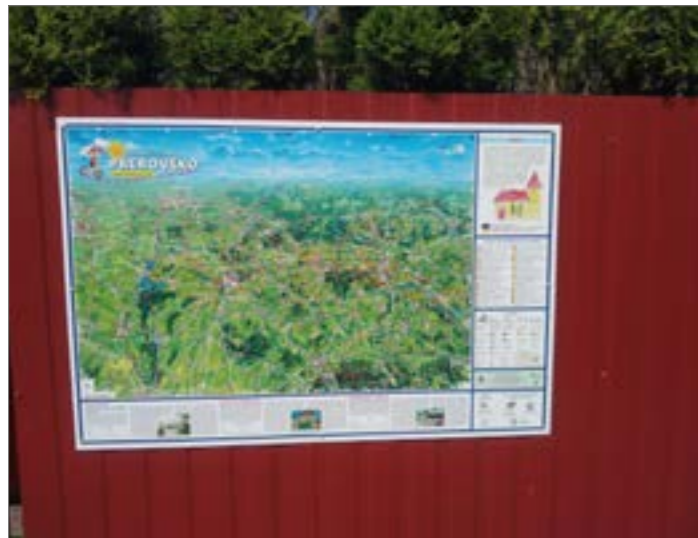
Na plotě MŠ přibyla malovaná cyklomapa, na jejíž tvorbě se podíleli žáci Mateřské školy.