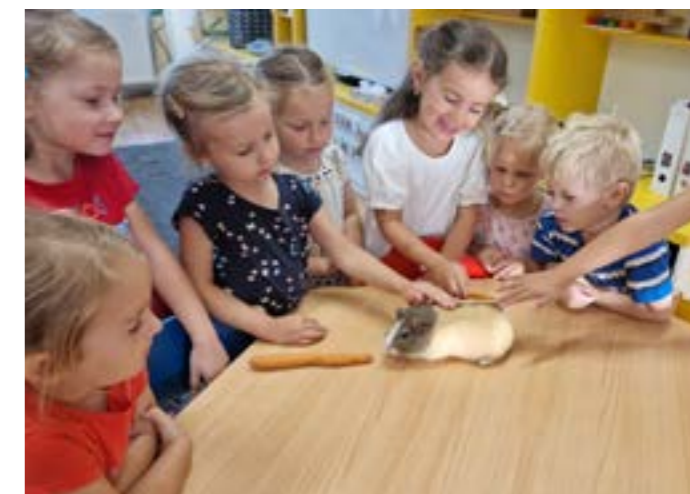
Děti se seznámily s našimi školkovými zvířátky a učí se o ně pečovat.