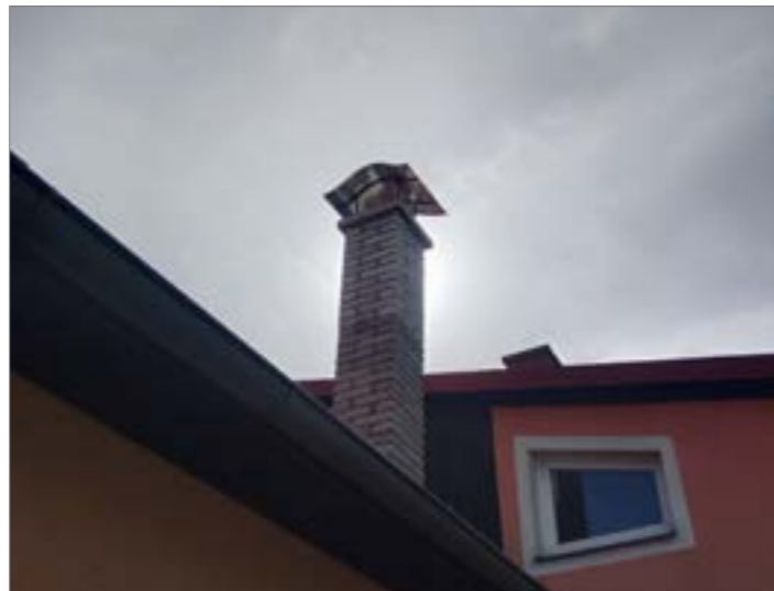
Havarijní stav komínu na hasičské zbrojnici si vyžádal jeho velkou opravu.