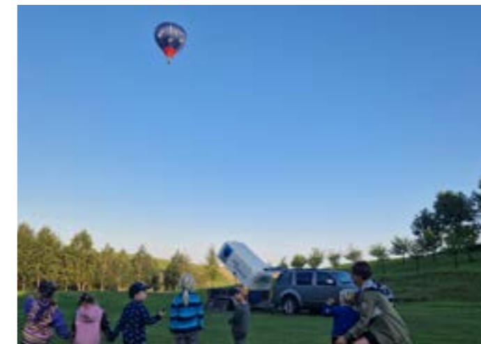
Hned první dny jsme vyrazili zkoumat okolí školky. O bombastický zážitek se dětem postaral pan Andrš, když nafoukl létající balón.