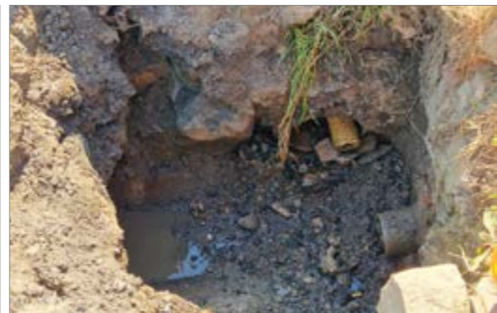
V zatáčce při výjezdu z obce na Vrbičkovou byl dlouhodobě poškozený kanál, na což bylo obcí upozorňováno. Až když došlo k havarijnímu stavu, začal správce komunikace konečně s opravou.