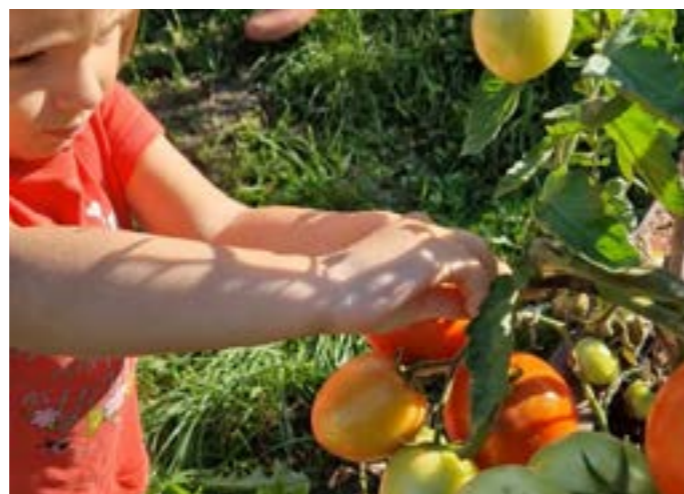
Pěstování ovoce a zeleniny se nám na přírodní zahradě daří. Ještě o prázdninách jsme stihli sklídit a pojmít cukety, rajčata, maliny, ostružiny, mrkev, hrášek, rybíz, hroznové víno, angrešty i jostu. Papriky a jablka nám teprve dozrávají.