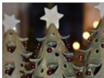
Adventní čas.....str. 12