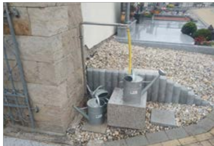
Nové nerezové vodovodní připojení a s tím související prvky byly úspěšně dokončeny a věříme, že budou nám všem sloužit „na věky“.