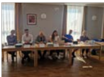
Nepřehlédněte.....str. 2 až 3