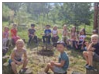
Školka v obrazech.....str. 8 až 10