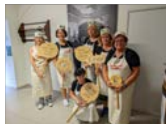
Spolkový život.....str. 11 a 12