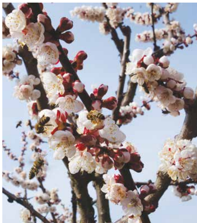
Letos rozkvetly stromy velice brzy, což pochopitelně neuniklo ani včelám. Tento snímek byl v jedné místní zahradě pořízen 3. dubna.