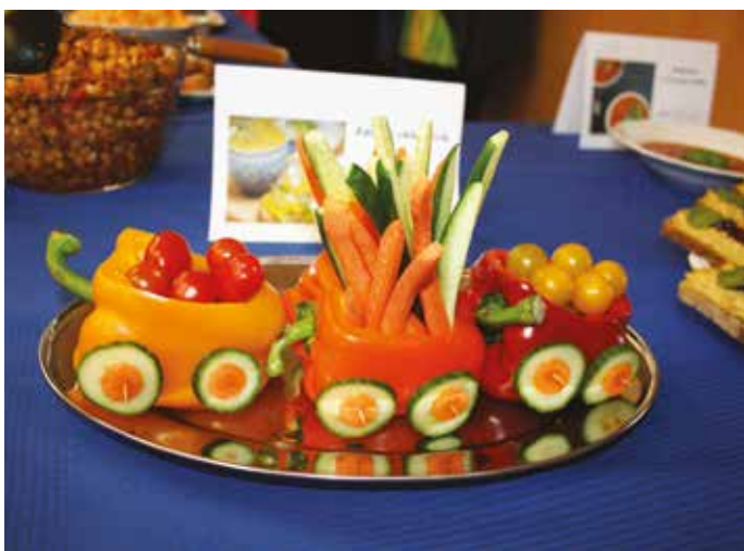
Špičkový Gastrofestival nabídl spoustu nápadů. Více na str. 10.