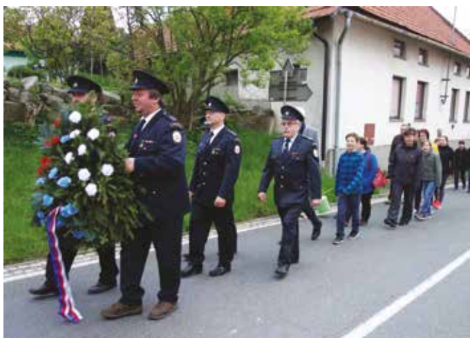
V úterý 7. května se uskutečnilo pietní setkání k uctění obětí Druhé světové války.