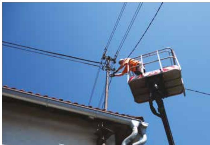
Počátkem června byla v naší obci provedena výměna části elektrického vedení veřejného osvětlení.