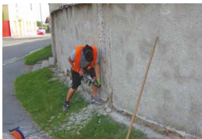
V červnu byla zahájena druhá etapa opravy hřbitovní zídky.