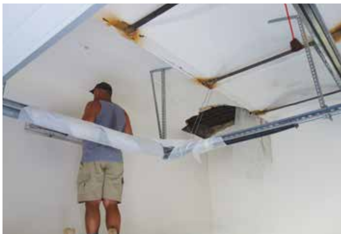
V červnu byla zahájena oprava hasičské zbrojnice.

POKRAČOVALI JSME V OPRAVÁCH A UCTILI JSME PAMÁTKU VÁLEČNÝCH OBĚTÍ