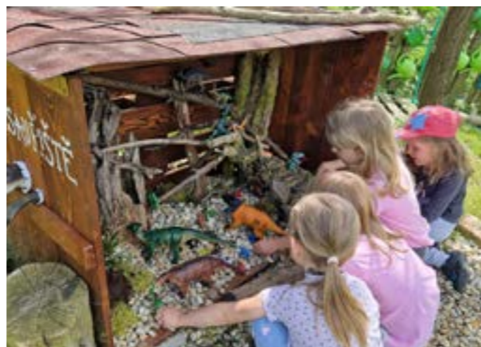
Koncem března proběhla 10. schůzka našeho Ekotýmu. Na ní jsme naplánovali a vytvořili několik plánů činností k projektům ke zlepšení našeho prostředí a zkvalitnění výuky. Třeba jako Dinosauřitě vpravo.