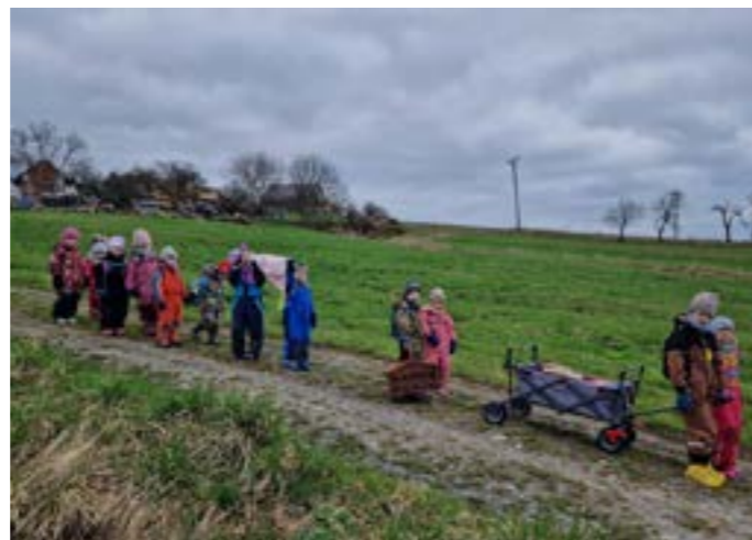
V březnu jsme navštívili knihovnu v Lipníku nad Bečvou, kde si pro naše děti připravili výukový program o včelách. Nezapomněli jsme na tradiční vynášení Morany.