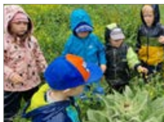
Školka v obrazech.....str. 8 až 10