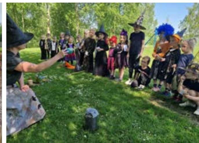
Navštívili jsme i farmu v Kunčicích, která děti naprosto uchvátila. Pro děti jsme na konci dubna připravili spoustu čarodějnických aktivit na hřišti i ve třídě.