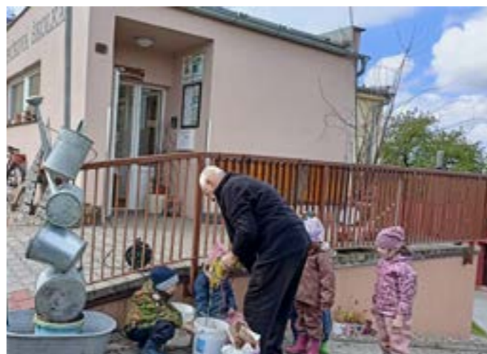
Nebo také Cesty ze starých desek či Konvičkovník. Důležité pro nás je, že se děti se svými rodinami podíleli na plánování i na plnění jednotlivých úkolů a byli u celého procesu od začátku do konce. Děti tak brousily brusku, vrtaly vrtačkou, natíraly, betonovaly, osazo-