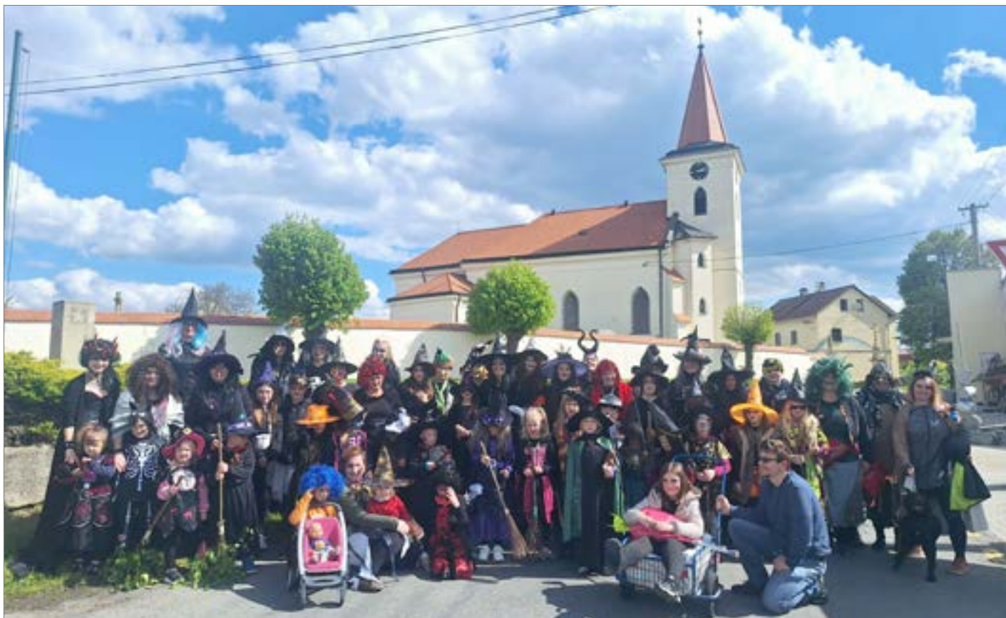
O čarodějnicích píšeme na straně 9.