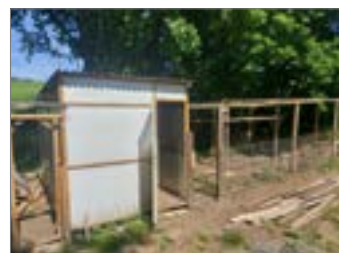
Spolkový život.....str. 3, 11 až 12