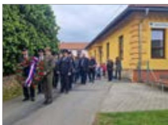
Máme za sebou.....str. 2 až 3