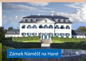
Zámek Náměšť na Hané